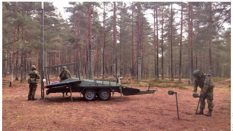
Das Aufklärungssystem kann schnell in den Einsatz gebracht werden.