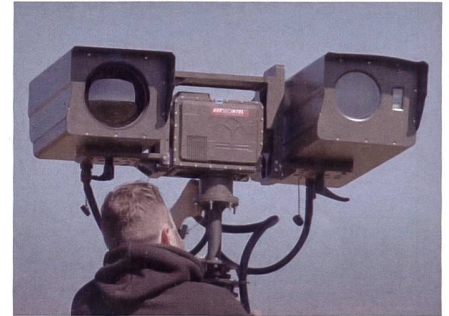
Quasi als transportierbarer Aufklärungsturm kann es Geländeabschnitte überwachen.

Dabei geben NATO-Mitgliedstaaten Grossgerät aus vormals sowjetischer Produktion an die Ukraine ab und erhalten dafür verfügbare Systeme aus westlicher Produktion. +