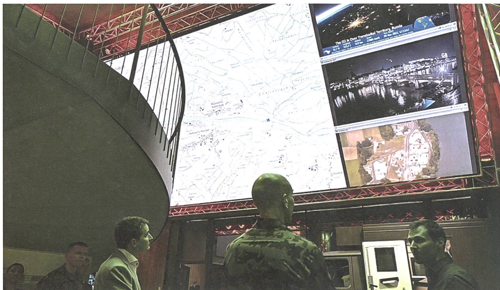
Um die stetig zunehmende Komplexität der IT-Digitalisierung im Sicherheitsumfeld zu berücksichtigen, hat RUAG das Programm C5I gestartet.

Wie im Geschäftsjahr 2022 werden zukunftsgerichtete Investitionen sowie die Bereinigung von Altlasten, insbesondere in Zusammenhang mit der IT-Infrastruktur