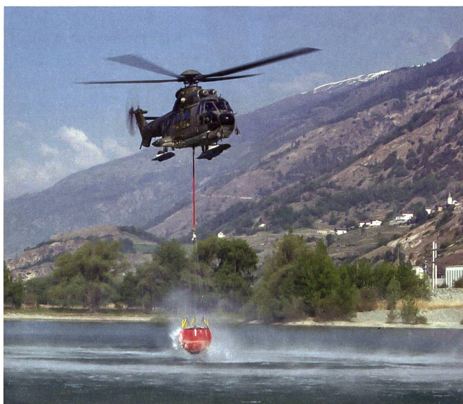
Museumstag vom Samstag, 1. Juli 2023: Im Zentrum steht das Thema «Die Armee hilft».