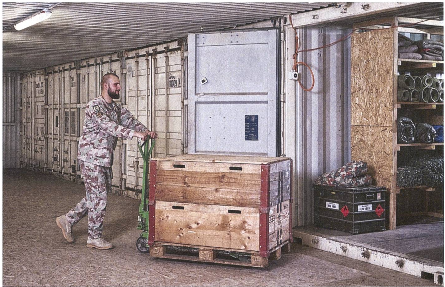
Die Armee muss sich von einer betriebswirtschaftlichen Logistik verabschieden.

Dieser Mehrwert erstreckt sich auch auf viele andere Bereiche. Beispielsweise ist das Know-how, das die Luftwaffe im Kosovo oder im Rahmen der Katastrophenhilfe im Ausland erworben hat, wertvoll. Die eingesetzten Besatzungen berichten von der Erfahrung, die sie bei der Navigation über grosse Entfernungen gewonnen haben, wobei sie oftmals eine andere Bedrohungslage als in der Schweiz angetroffen haben. Besonders hervorzuheben ist, dass dieses Know-how in der Schweiz allein nicht erlangt werden kann.