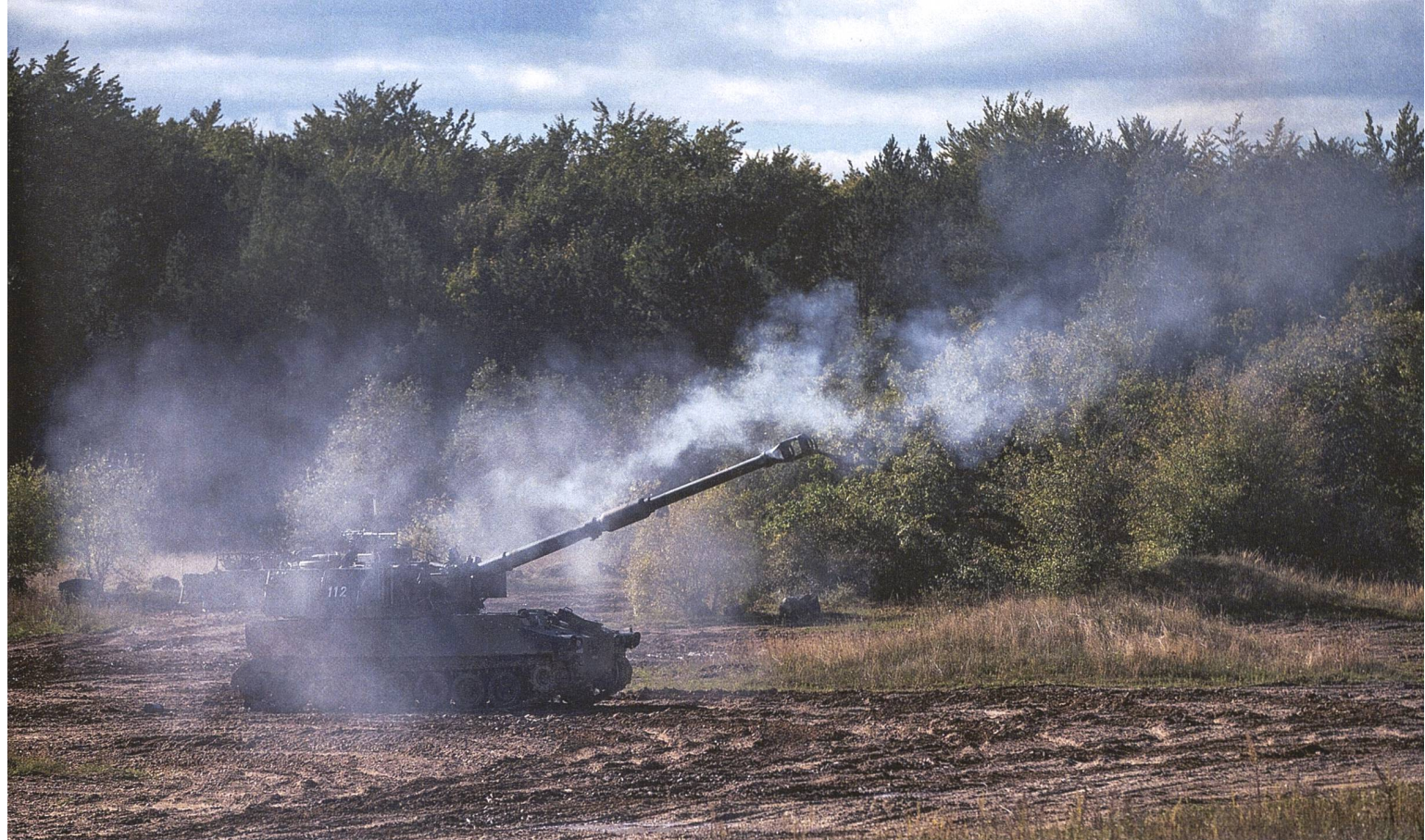
Mechanisierte Brigaden werden 2024 systematisch mit anderen Verbänden trainieren, wie etwa der Infanterie oder der Logistik.

Waffenplätzen effektiv trainiert werden können. Nur bei Verbandsübungen kann die Zusammenarbeit zwischen den Truppengattungen oder mit zivilen Partnern trainiert werden. Die Übungen müssen auch lange genug dauern, um die Diensträder und damit die Durchhaltefähigkeit zu trainieren.