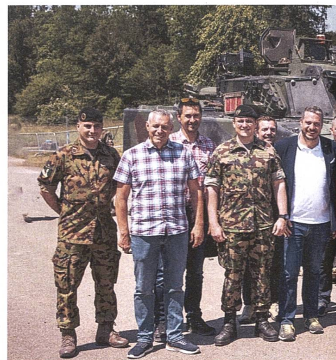
Die Regierung des Kantons St. Gallen überzeuget die Bataillone 13.

An diesem Freitag wird die Panzerkompanie 13/1 beübt, sie hat den Auftrag, als