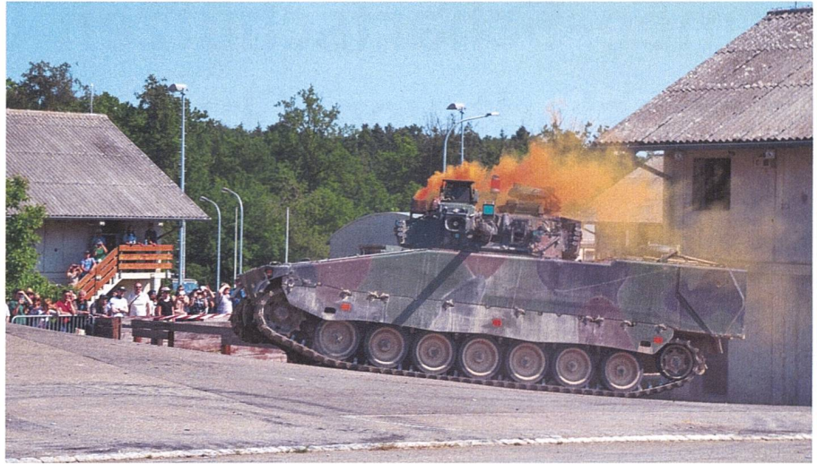
Ein Kampfgeschützenpanzer wurde im Dorfzentrum vom Gegner getroffen.

zenpanzer nach, welche das Feuer auf die verbliebenen gegnerischen Kampfmittel eröffnen. Erst nachdem die eigene Aufklärung auch den Austritt aus der Ortschaft als feindfrei erkannt hat, kann mit dem Geniepanzer Kodiak das vom Gegner auf der Hauptverkehrsachse errichtete Hindernis geräumt werden. Anschliessend stösst der Panzerzug durch die Ortschaft und sichert mit seinen weitreichenden Kanonen den Austritt aus der Ortschaft.