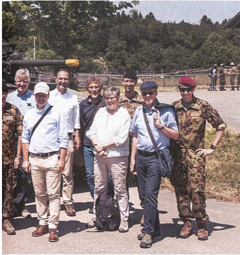
...ich von der Einsatzfähigkeit des Panzer-