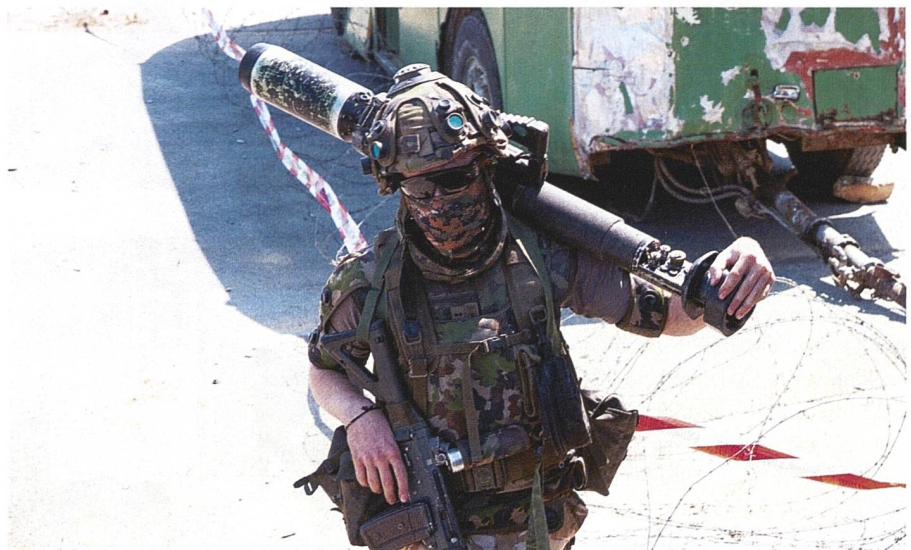
Mit der Simulationsausrüstung für Soldat und Waffen lässt sich der Einsatz der Panzergrenadiere komplett auswerten.