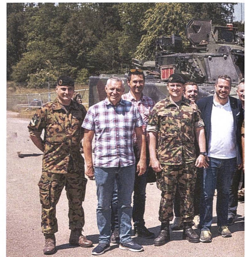
Die Regierung des Kantons St. Gallen überzeuget die Bataillone 13.

An diesem Freitag wird die Panzerkompanie 13/1 beübt, sie hat den Auftrag, als