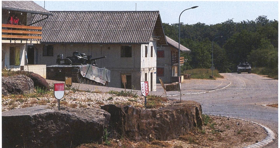
Die Kampfschützenpanzer stossen von Osten in den Dorfkern vor und geben den abgessenen Panzergrenadiern mit ihrer Hauptbewaffnung Feuerschutz.