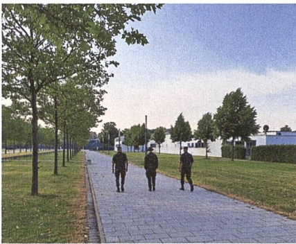
In der Kaserne Ingolstadt.

Nach der Ankunft in der Pionier-Kaserne in Ingolstadt, konnten die Wettkampfunterlagen und die Startnummern entgegengenommen und die Zimmer bezogen werden. Jeder Wettkämpfer hat ein Einzelzimmer für sich bekommen.