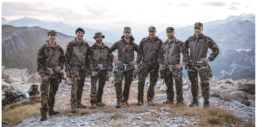
Die Soldaten und Kader waren für drei Tage in Andermatt stationiert.

Infolge der vielen Sternschnuppen startete der dritte und letzte Tag etwas nach den eingeplanten 5 Uhr in der Früh'. Die letzten Stunden wurden genutzt, um die Seiltechniken und die Kompetenzen der Tourenplanung zu vertiefen. Mit dem Abschluss des Kurses ist dies keinesfalls abgeschlossen. In den kommenden WKs - sowohl im Sommer, wie auch im Winter - sollen die angeeigneten Kompetenzen stets erweitert und vertieft werden. +