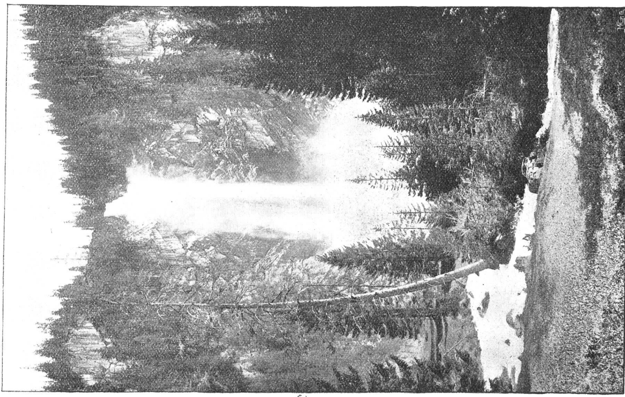
Zwei Wasserfälle im Simmental.