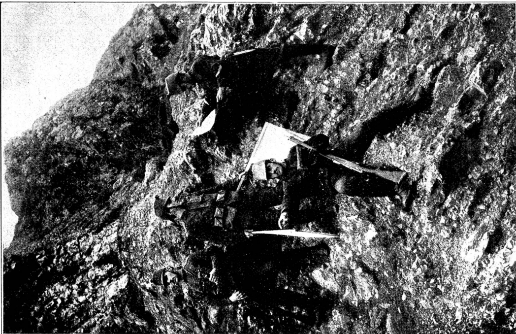
Selbständiger Beobachtungsposten beim Signalisieren. Bei sehr mühsam und schwierig zu begehenden Wegen werden wichtige Meldungen durch diesen Hilfsdienst nach der Hauptwache hinunter befördert.