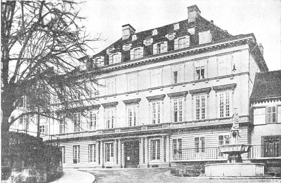
„Der Kirchgarten“. Das Gebäude, welches Basel für die Weltbank zur Verfügung gestellt hat.