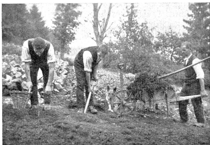
Arbeit im Taubstummenheim Netendorf.