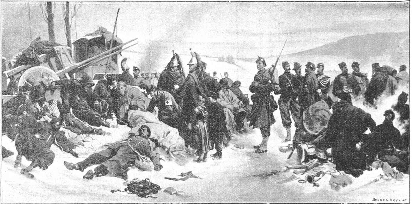
Die Bourbaki-Armee in Verrières.

Aus dem Werk Th. Curti „Geschichte der Schweiz im 19. Jahrhundert“, mit Genehmigung des Verlages Librairie-Edition S. A. Bern.