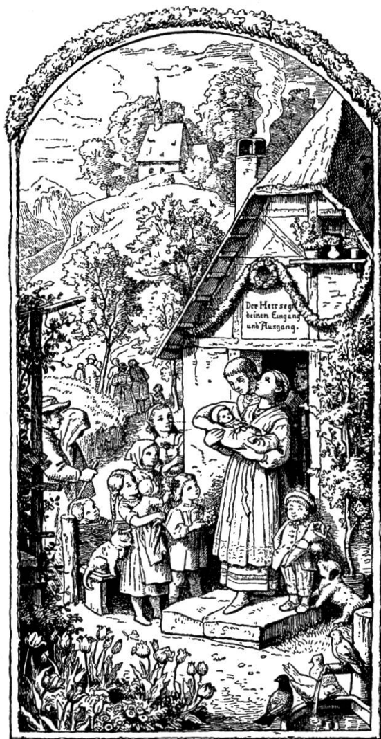
Zeichnung Ludwig Richter.

Pfingsten vor 100 Jahren. Natur- und Gottverbundenheit, Glockenklänge, Predigtgänger. Junge Mutter mit dem Täufling auf den Armen bittet emporschauend um den Pfingstsegen für ihr geliebtes Kind. Links die Taufpaten. Kinder feiern den Täufling bei seinem ersten Ausgang mit Blumensträußchen.