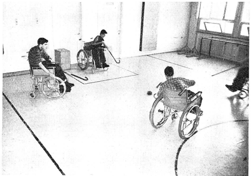
Ein wichtiges Moment in der Wiedereingliederung Invaliden: sportliche Betätigung

lege den rechten Arm auf den Rücken und probiere, wie du deine Schuhe binden willst. Du wirst sehen, wie schwer das ist! Wasche einmal dein Gesicht, ohne deine Hände zu gebrauchen. Ei, da merkst du, wie froh du bist, daß du noch Hände und Arme hast. Geh einmal auf einem Fuß stehend zu Bett! Das alles muß der Invalide mühsam erlernen. —