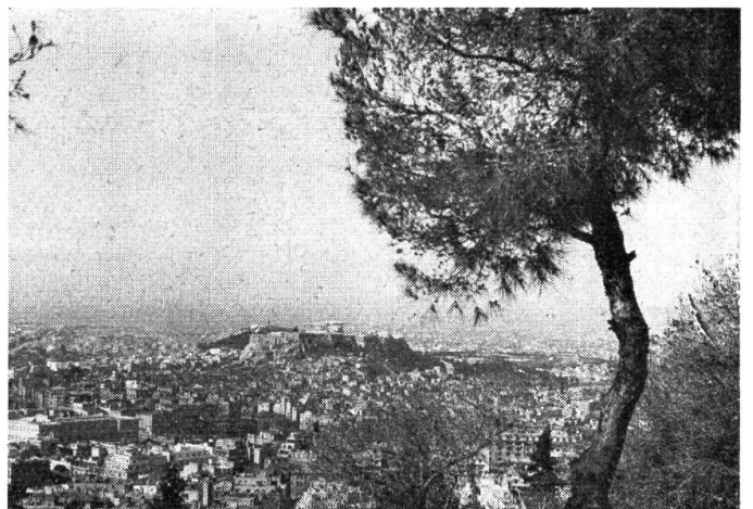
Blick auf die Millionenstadt Athen. In der Bildmitte sehen wir den Felsenhügel der Akropolis mit den Tempelbauten.

Eine Stunde Aufenthalt! Die Dan-Air trinkt Benzin und wird gebürstet und gefegt. Dann steigen wir ein. Brindisi ist unser nächstes Reiseziel. Der Süden ist heute grau und bewölkt, es dämmert schon um 6 Uhr. Wir haben nur selten Durchblicke durch die Wolken. Erst an der italienischen