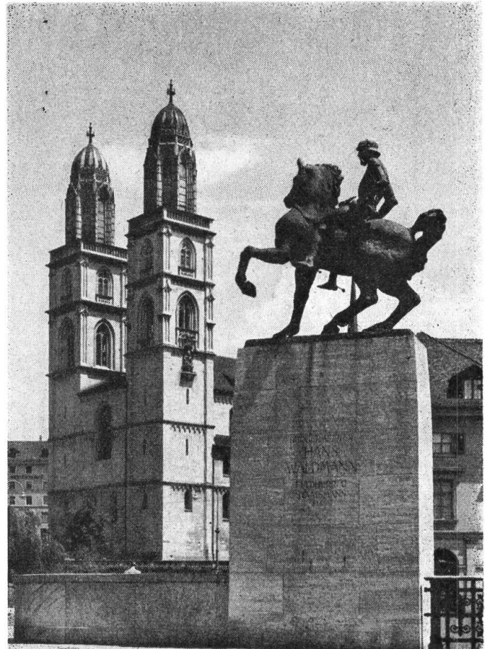
Hans Waldmann, Feldherr und Staatsmann. — Denkmal dieses eigenwilligen Eidgenossen. Im Hintergrund das Grossmünster.

Im Alter von ungefähr 30 Jahren heiratete Hans Waldmann eine reiche Witwe mit einem Eisenhandel. Er wohnte nun im Einsiedlerhof, dem heutigen Zunfthaus zur «Meisen» am Münsterplatz. Die Schneider waren Mitglieder der Schneiderzunft, die Metzger waren in der Metzgerzunft usw.