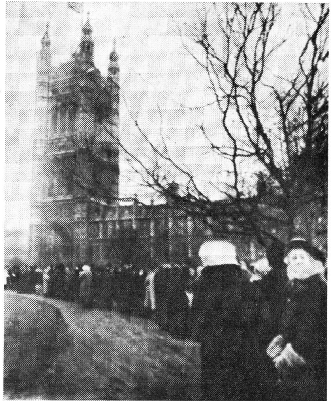
In einem endlosen Trauerzug erwiesen die Engländer ihrem großen Mann die letzte Ehre.

Die Nachricht von Churchills Tod erfüllte die ganze Welt mit stiller Trauer und Ehrfurcht vor dem Lebenswerk des Heimgegangenen. Nur Rotchina machte eine Ausnahme. — Man erinnerte sich, daß Churchill im Jahre 1940 durch seinen Widerstand gegen das Hitlertum die Freiheit Europas gerettet hatte. Polen war besiegt, Frankreich war besiegt, Dänemark, Norwegen, Belgien und Holland hatten ihre Freiheit verloren. Niemand zweifelte daran, daß nun auch England rettungslos verloren sei. Bei Ausbruch des Krieges am 1. September 1939 war Churchill Minister und Chef der Seestreitkräfte Englands geworden. In den Tagen der größten Gefahr