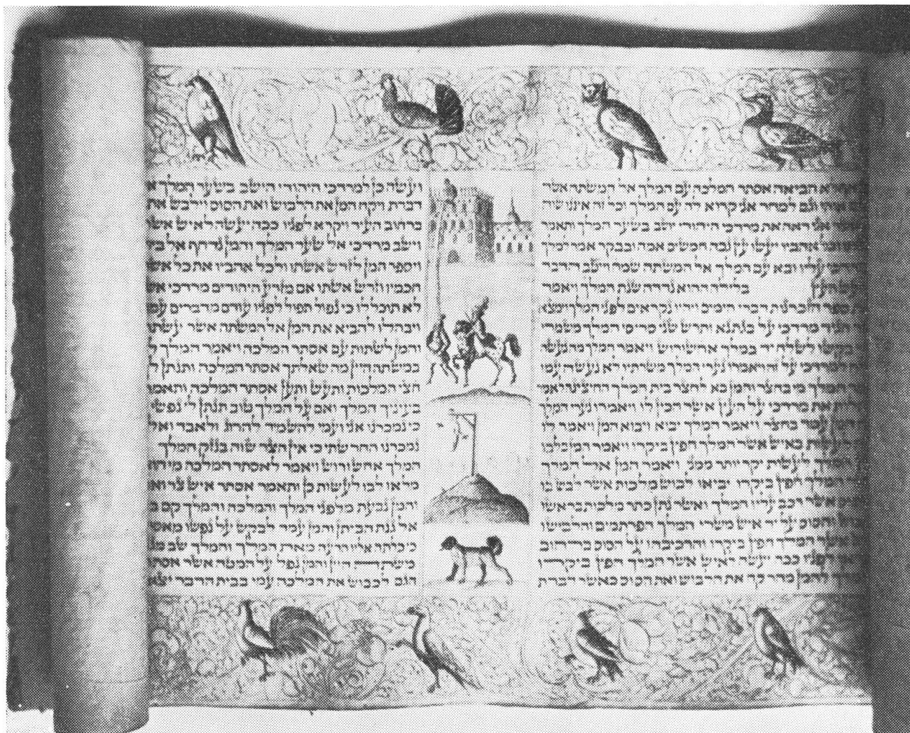
In der Schweizerischen Landesbibliothek in Bern befindet sich die größte Bibelsammlung Europas. Sie enthält rund 3000 Bände in 450 Sprachen. Unser Bild zeigt eine Schriftrolle aus dem Buche

Jede Zeit hat ihre Bücher und jedes Buch hat seine Zeit. Ist die vorüber, so ist das Buch veraltet und bald vergessen. Neue Bücher treten an ihre Stelle, die dem Geschmack der Zeitgenossen besser entsprechen. Aber ein einziges Buch hat alle die andern überlebt. Es wird seit Jahrhunderten gelesen und ist heute in fast alle Sprachen der Welt übersetzt worden. Das ist die Bibel. Dieses seltsame Buch hatte nicht etwa lauter Freunde, sondern auch mäch-