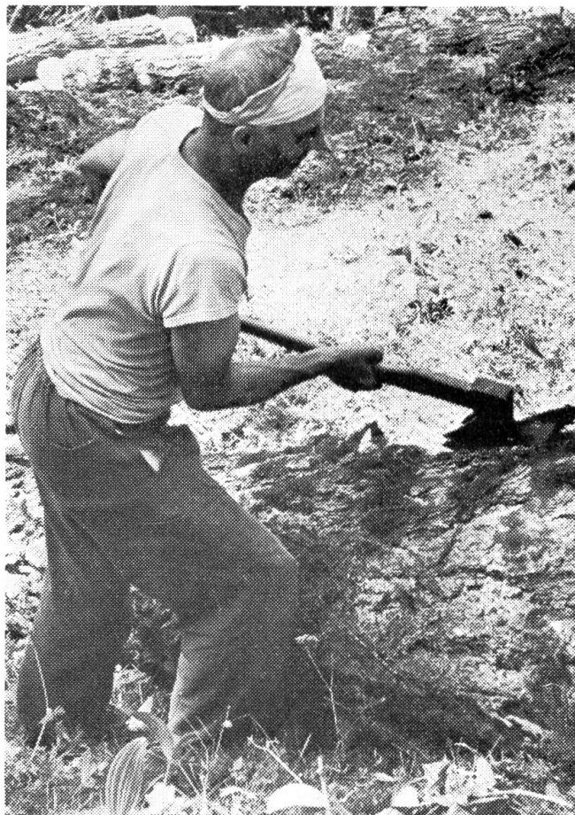
Ein Arbeiter aus Albinen zeigt den Zivildienstlern, wie man eine gefällte Lärche bearbeitet.

In keinem Land und Volk hat die Armee ausschließlich Freunde und Befürworter, sondern auch Gegner. Man hört auch bei uns von Pazifisten und Militärdienstverweigerern, die die Armee als untaugliches Mittel zur Erhaltung des Friedens bezeichnen und deren Abschaffung verlangen. Schon wiederholt mußten sich unsere Gerichte mit Militärdienstverweigerern beschäftigen und sie zu harten Strafen verurteilen. Es sind nicht immer Drückeberger, die sich der Dienstpflicht entziehen