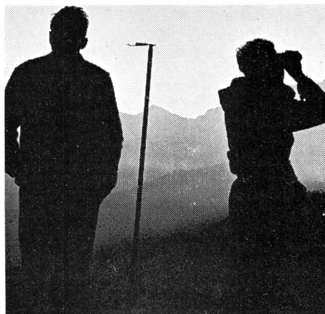
Ausschau nach Vogelschwärmen im Morgenrauen