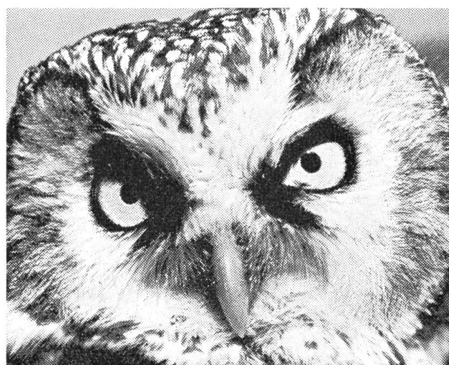
Rauhfußkauz — ein Mäuseschreck