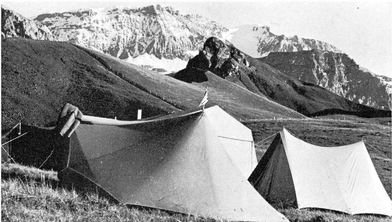
Zeltlager in luftiger Höhe

Eben ist ein Buchfink in das feine Netz geraten. (Siehe Bild.) Er schlägt mit den Flügeln um sich, zerrt am Netz und versucht loszukommen. Aber er ist darin gefangen wie eine Fliege im Spinnennetz. Und schon kommt einer der Vogelfänger. Wird er dem armen Buchfink den Hals umdrehen? — So machen es nämlich die Vogelfänger in Italien mit den kleinen Singvögeln. — Aber nein, so schlimme