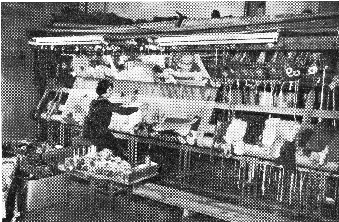
Unter den geschickten Händen der Weberin entsteht ein wundervoller Wandteppich.

In Frankreich ist dieses Kunsthandwerk nie ganz ausgestorben. In neuester Zeit ist auch in unserem Lande die Freude an Wandteppichen erwacht. Vor mehreren Jahren wurde in Schaffhausen das Innere des alten Münsters renoviert. Wenn ich mich recht erinnere, hatten sich einige Schaffhauser Frauen bereit erklärt, für die Chorwand (Vorderwand) einen grossen