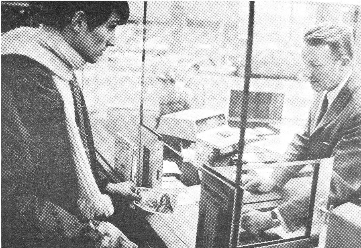
Die französische Regierung hat zur Sanierung ihrer Währung u. a. eine strenge Devisenkontrolle eingeführt. Wer das Land verlässt, darf nicht mehr als 200 Francs in Noten und 500 Francs in Devisen mitnehmen. Der junge Mann auf unserm Bild muss als Grenzgänger sogar mit 50 Francs auskommen.