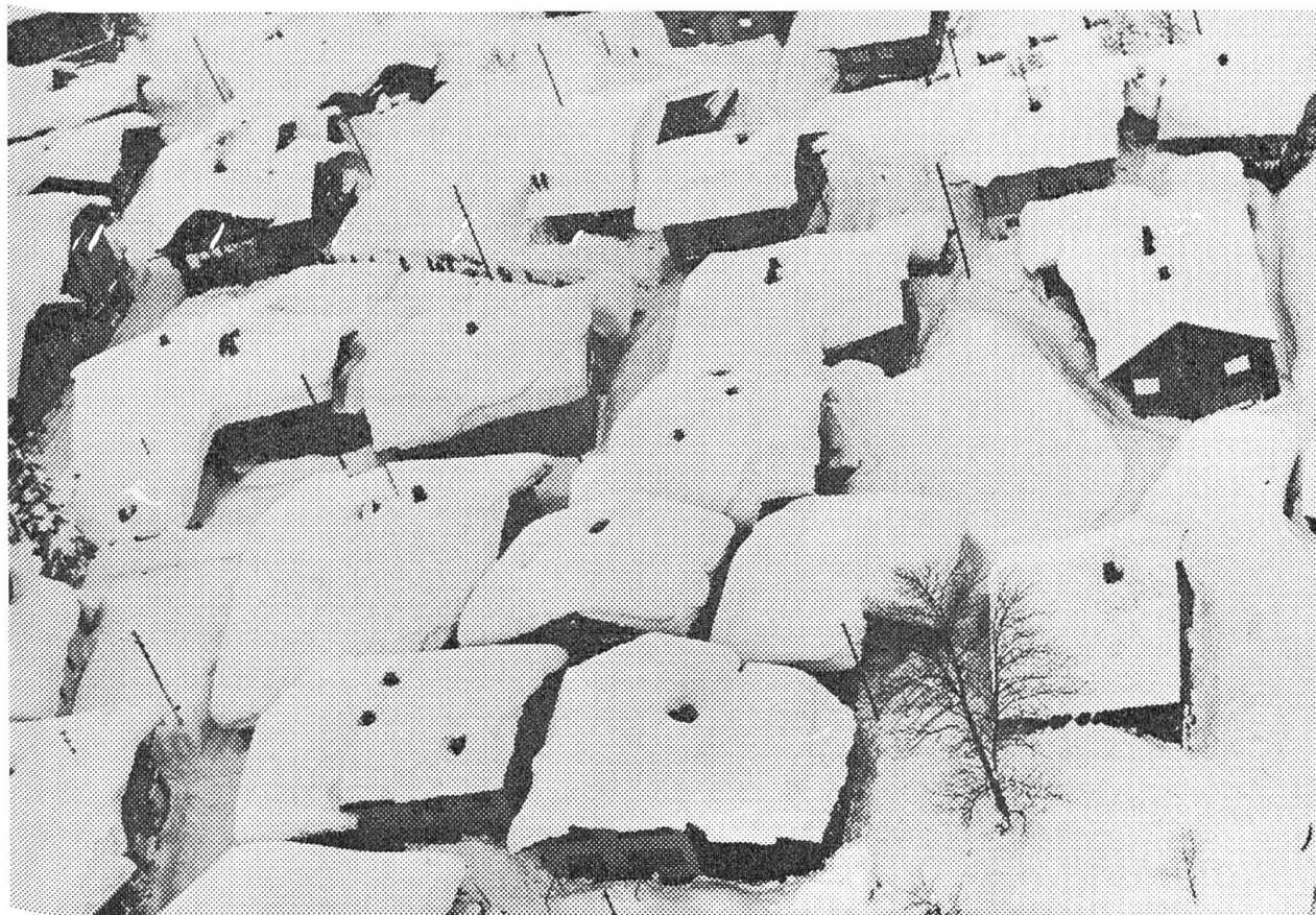
So tief verschneit war Guttannen im oberen Haslital anfangs dieses Monats.

Aber so einen mächtigen Schneefall wie in den letzten Januar-Tagen haben auch die Bewohner der Alpentäler selten erlebt. So lagen z. B. die Bergdörflein Guttannen im oberen Teil des Haslitales und Gadmen an der Sustenstrasse meterhoch im Schnee. Es war während ein paar Tagen nicht mehr möglich, das Haus durch die Türe zu verlassen. Man musste ein Fenster im oberen Stock als Aus- und Eingang benutzen. In Gadmen mussten die Schüler durchs Fenster ins Schulhaus einsteigen.