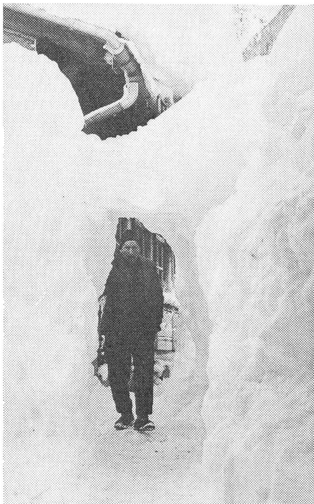
Auch die ältesten Einwohner von Guttannen können sich nicht erinnern, jemals soviel Schnee gesehen zu haben wie im vergangenen Januar.