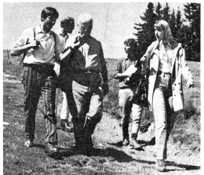
«Rigi-Bergstürmer» auf dem Heimweg. — Jugendlager Weggis 1970.