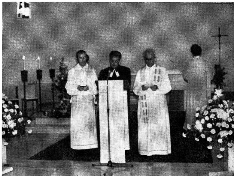
In der neuen katholischen Kirche fanden sich die Bürger von Glarus und die Delegierten des SVTG in einem ökumenischen Gottesdienst im gemeinsamen Gebet.