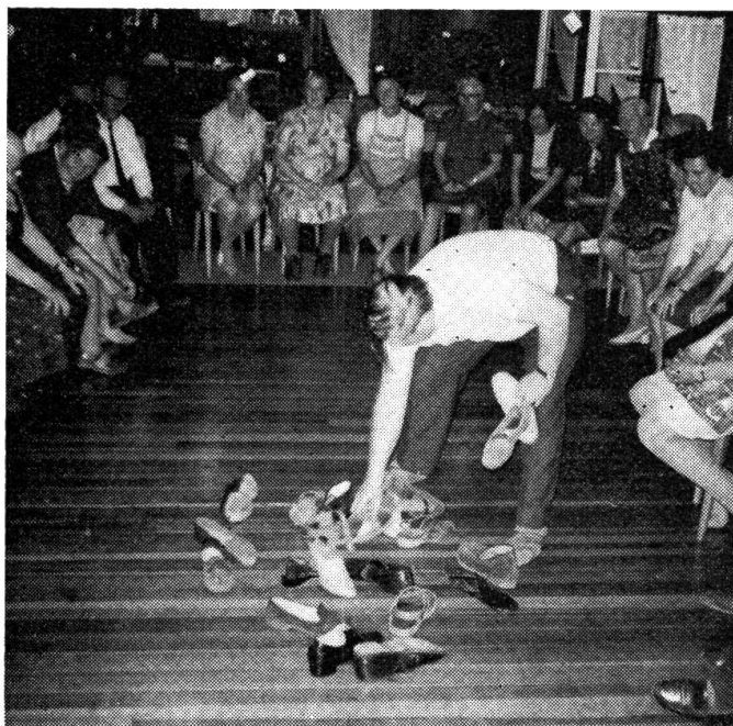
Schnapsschuss vom «Bunten Abend»

An andern Nachmittagen unternahmen wir gruppenweise Wanderungen, wie z. B. eine Alpwande-