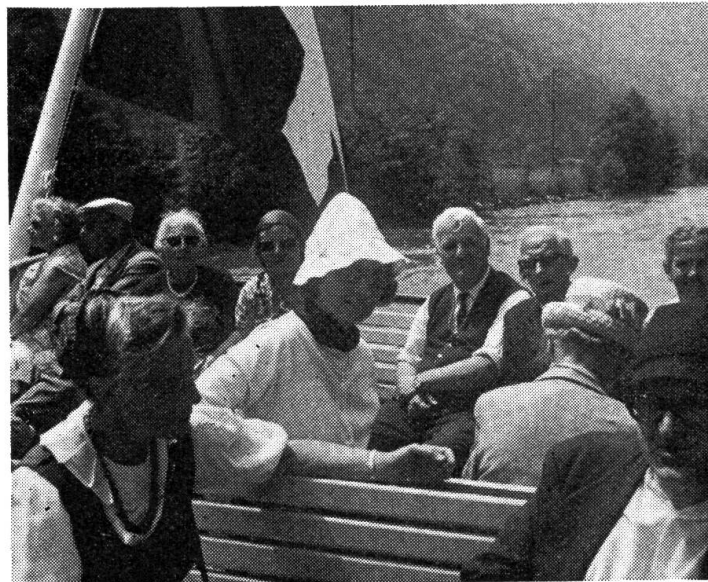
Schifffahrt auf dem Thunersee

rung auf die Birchegg oder eine herrliche Wanderung durch das Suldtal bis zum grossen Wasserfall und zur Suldhütte.