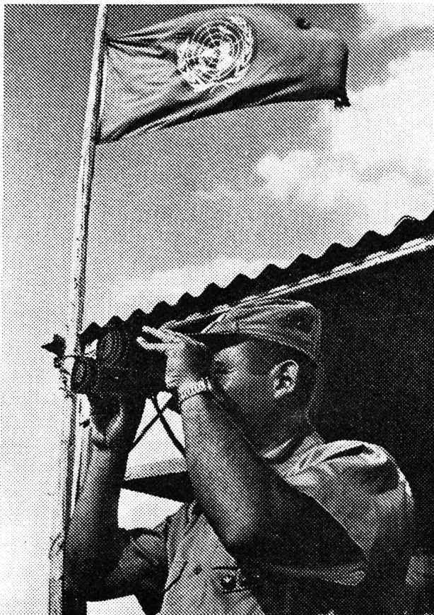
UNO-Truppen sorgen für Innehaltung des Waffenstillstandes.

In den ersten Tagen des 4. Nahost-Krieges erlebten die Israelis manche böse Überraschungen. Die Araber flüchteten nicht mehr, sie kämpften. Sie waren besser vorbereitet in den Krieg gezogen. Sie hatten auch von den Russen eine ganz neue, bisher noch nie im Kampfe verwendete Waffe erhalten. Die neuen russischen «SAM»-Raketen schossen fast die Hälfte aller israelischen Flugzeuge ab. Aber dann gelang den Israelis an einer Stelle die Überquerung des Suezkanals. Eine ägyptische Armee von mehr als 20 000 Mann wurde