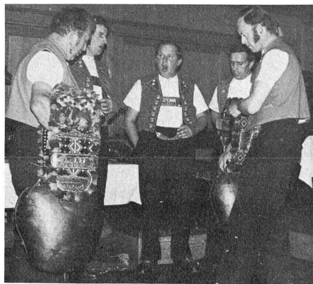
Heimatliche Klänge aus Appenzell