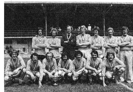
Der Cup-Sieger Zürich I.