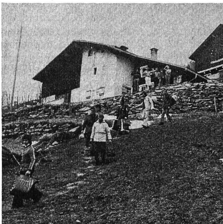
«Lebt wohl, und kommt bald wieder ein-mal!» Gehörlose Gäste nehmen Abschied vom heimeligen Berghaus.

tigt. Ich habe auf der Wanderung den Teilnehmern Auskünfte gegeben, was vor 175 Jahren bis heute im Sernftal ge-schehen war.