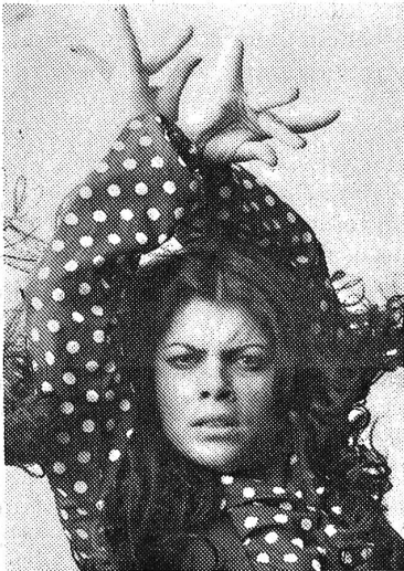
La Singla — ausdrucksstark und temperamentvoll.

plauderte Susanne im «Blick» vom 8. Februar 1975 aus. Diese Reporterin berichtete, die weltberühmte Zigeunerin werde demnächst die Hauptdarstellerin in einem österreichischen Film sein. Der Regisseur Lesowky soll der Reporterin erzählt haben: «Es ist die Lebensgeschichte von La Singla, die taubstumm zur Welt kam und durch einen Schock plötzlich sprechen und hören kann. — Vorher konnte man lesen, La Singla sei durch eine Operation von ihrer angeborenen Taubstummheit befreit worden, und jetzt soll ein Schock dieses «Wunder» bewirkt haben. (Schock: plötzlich körperliche oder seelische Erschütterung — Nervenschock.) Was ist nun wahr? Ro.