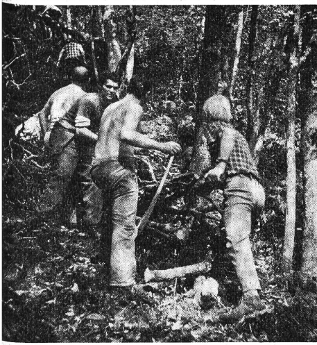
Glarner Gehörlose im freiwilligen Arbeits-einsatz für ihr Berghaus Tristel: Holz-rüsten im Gemeindewald.