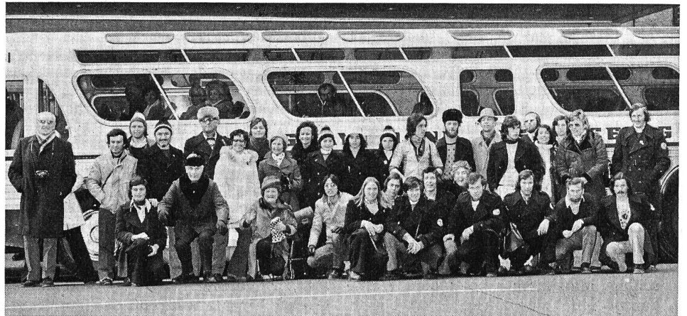
Familienbild der Sportler und Schlachtenbummler vor dem riesigen Autocar, der sie nach dem Abschluss der Winterspiele nach New York brachte.

Beinahe alle Jahre wieder gibt es eine Stolperei bei der Hürde Abrechnungen der Unterabteilungen. Bei der Abrechnung der Abteilung Fussball wurde eine neue, klarere Darstellung gewünscht.