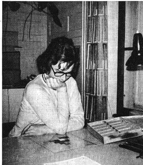
Ein schwieriges Problem!

ausgeklügelte, wissenschaftlich begründete Tests (= Prüfungen). Diese Prüfungen ermöglichen es dem Berufsberater oder der Berufsberaterin, wertvolle Hinweise und Ratschläge für die Wahl des Berufes zu geben. Es ist für die Schüler immer ein grosser Tag, wenn sie zum Berufsberater gehen dürfen. Sie sehen diesem Tag mit erwartungsvoller Freude und Spannung entgegen. In St. Gallen z. B. kann jeder Berufswahlschüler mindestens einmal den Gang zum Berufsberater machen. Wenn das Resultat der Schnupperlehren nicht befriedigt, dann wird der Berufsberater ein zweites Mal aufgesucht.