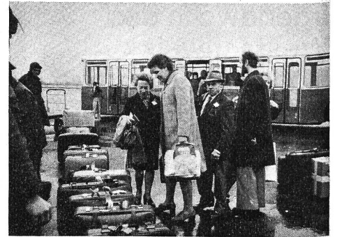
Kofferkontrolle vor dem Abflug

Auf der Rundfahrt durch die Stadt Beirut (zirka 0,7 Millionen Einwohner) fielen uns am meisten die grossen Gegensätze auf. In den neuen Stadtteilen mit modernem Verkehr stehen Hochhäuser und gibt es schöne Parkanlagen. Wir besuchten auch den Markt in der Altstadt. Wir waren überrascht von dem grossen Angebot an herrlichen einheimi-