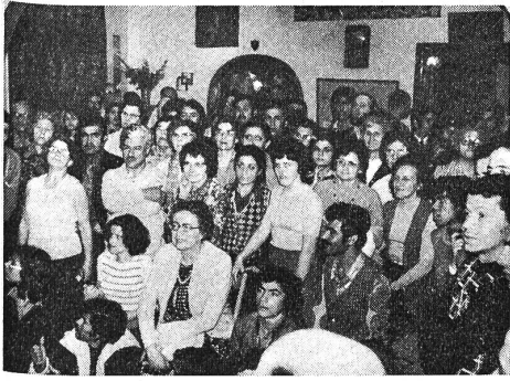
Als Gäste in den Klubräumen der Beiruter Gehörlosen.

Am Nachmittag besuchten wir die antike Stadt Babylus . Hier befindet sich eine von den Kreuzfahrern im 12./13. Jahrhundert erbaute Zitadelle (Festung, Burg). Von ihrem flachen Dach aus hatten wir eine prachtvolle Rundschau über das Ruinenfeld, zu den römischen Kolonnaden (Säulenreihen) und auf das Meer. Auch die Königsgräber aus dem 13. Jahrhundert vor Christus und die Ueberreste des ehemaligen römischen Amphitheaters besichtigten wir. — Hier wurden Ausgrabungen gemacht. Die Funde konnten wir an einem andern Tag im Archäologischen Museum in Beirut anschauen. — Auf der Rückfahrt machten wir einen längeren Halt bei den Jeitta-Grotten . Ein breiter, bequemer Weg führt in den Berg hinein. In der Höhle bestaunten wir die verschiedenartigen, in allen Farbschattierungen schimmernden Tropfsteine. Man muss diese Pracht selber gesehen haben, beschreiben kann man sie nicht. Man glaubte sich in einem Dom (grosse Bischofskirche) mit grossartigen Deckengemälden zu befinden. Ein herrliches Kunstwerk der Natur.