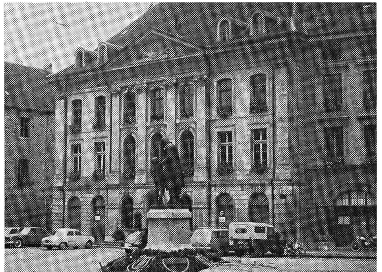
Das Pestalozzi-Denkmal vor dem Rathaus

Eine Kommission des waadtländischen Erziehungsrates machte mehrere Inspektionsbesuche in diesem Institut. Sie war von der Unterrichtsarbeit des jungen Mannes begeistert. Seither unterstützte die Regierung des Kantons das private Werk tatkräftig. 1828 wurde diese Schule den staatlichen Anstalten gleichgestellt. 1868/69 sorgte die Regierung dafür, dass die Näfsche Taubstummenschule im Schloss Carouge in Moudon ein neues Heim erhielt und sich wei-