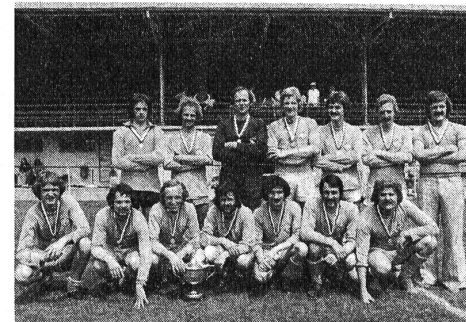
Der Cup-Sieger Zürich I.