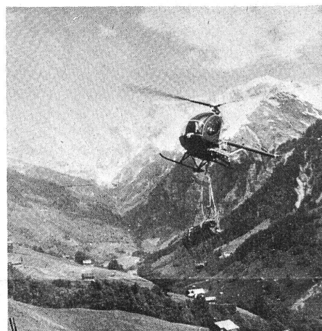
Der Helikopter mit seiner Ladung im Anflug zum Tristel.

die Last dann aus etwa einem Meter Höhe automatisch ausgeklinkt. Alles ging sehr schnell. Der Hinflug dauerte nur rund eine halbe Minute. Kaum hatten wir die nächste Ladung mit Seilen umbunden, war der Helikopter schon wieder zurückgekehrt. — Beim Anflug machten die Rotorflügel so starken Wind, dass wir trotz des schönen Wetters beinahe froren.