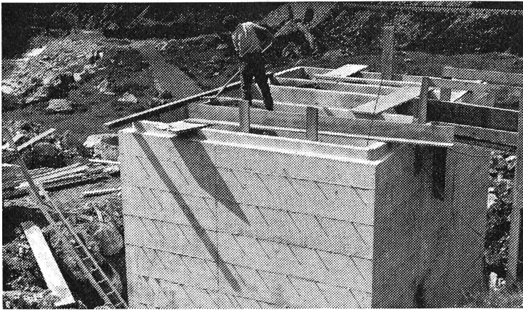
Ganz oben in den Bergen beginnt bereits die Verschmutzung unserer Gewässer.

Verwundert haben wohl in den letzten zwei Monaten viele der unzähligen Teilnehmer an Passfahrten über den Susten beim Anblick von Baustellen gefragt: Was wird denn hier wieder gebaut? — Es handelt sich um die Bauten einer Kläranlage. Schon seit langem musste man feststellen, dass die munter talwärts fliessenden Bergbäche durch die Abwässer aus Gastbetrieben, Touristenlagern und Truppenunterkünften arg verschmutzt werden. Die im Sommer