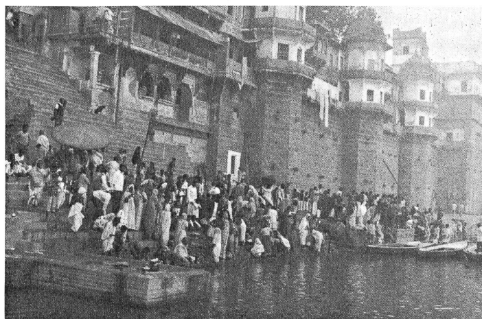
Hindus an den «heiligen Wassern» des Ganges. Links im Bilde führt eine breite Landungstreppe (Ghats genannt) zur Altstadt hinauf.

Schon um elf Uhr flogen wir mit der Maschine der Indian Airlines nordost-