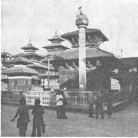
Der JAGANATH-Tempel in Katmandu.

richtungen. Diese Augen-Bildschnitzerarbeiten sind ein Sinnbild für die weltumfassende Güte und das Mitleid. — Rund um die Stupa sind Wohnungen von tibetanischen Familien und Klöster der Lamas (= Priester).