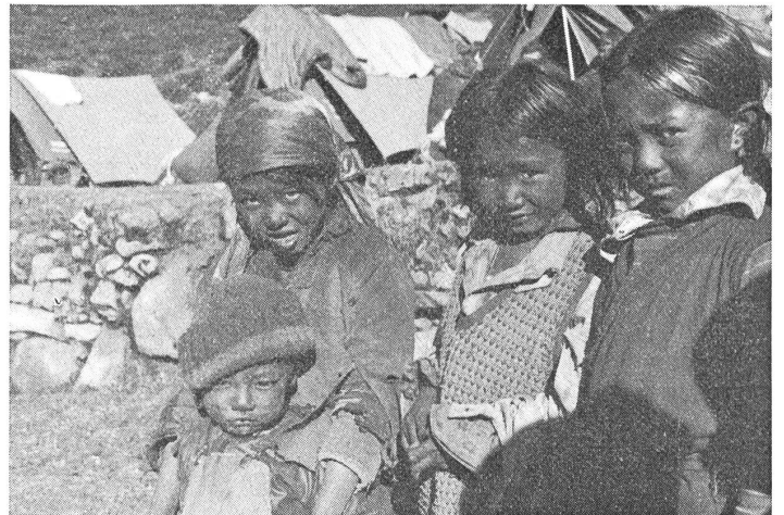
Kinder aus dem Volksstamm der Sherpas.

Wir sahen diesen buddhistischen Tempelbau schon während der Fahrt vom Flugplatz in die Stadt. Ein König Man hatte den Tempel vor 2000 Jahren erbauen lassen. Ueber einem quadratischen steinernen Sockel von 75 m Seitenlänge erhebt sich eine halbkreisförmige Kuppel. Zuerst auf dieser Kuppel schauen vier Augenpaare nach allen vier Himmels-