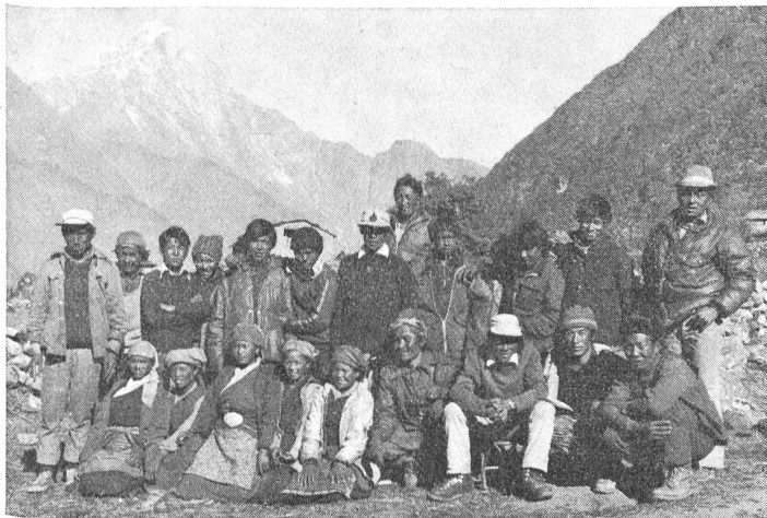
Sherpas und Sherpanissen unserer Expedition

Dies ist der volle Name des Königs von Nepal in der nepalesischen Staatssprache Pahari. Es gibt aber kein einheitliches nepalesisches Volk, und es wird auch nicht nur eine einzige Sprache gesprochen. Nepal wird von etwa zwei Dutzend Stämmen mit verschiedenen Sprachen bewohnt. Im Hochgebirge leben tibetansisch-mongolische Volksstämme, im Tiefland leben indo-arische Volksstämme. Dazwischen gibt es einen breiten Streifen von sprachlicher Vermischung.