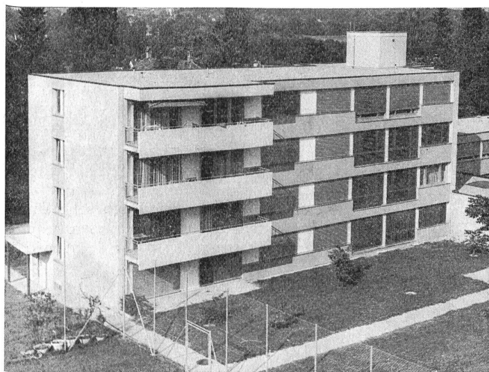
27. August 1976: Wohnhaus der Sonderabteilung