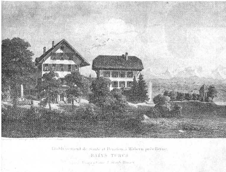
20. Juli 1874: Einzug in diese Gebäude

Am 27. August 1976 feierte man in Wabern das 150jährige Bestehen dieser Schule. An diesem Tag war sie allerdings schon mehr als 152 Jahre alt. Denn die heutige Taubstummen- und Sprachheilschule Wabern ist die direkte Nachfolgerin der ehemaligen «Privat-Taubstummenanstalt für Mädchen», welche am 2. August 1824 auf dem Landsitz Tschiffeli in der Enge, am nördlichen Rande der Stadt Bern, eröffnet wurde.