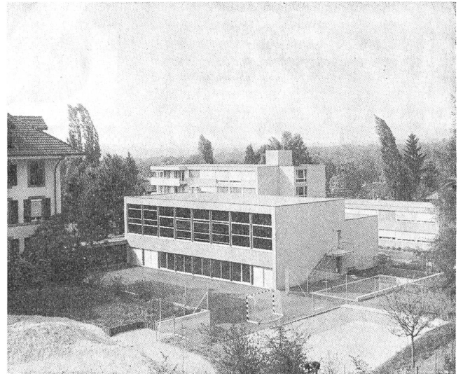
Teilansicht von der Südseite mit Turnhalle und Schwimmbad

Aus dem einfachen Aufbau der früheren Zeit ist also eine vielgliedrige Organisa-