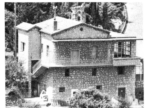
So sieht heute die Hinterfront aus.

Für alle Hilfe, die wir aus der Schweiz erhalten haben um die Renovation durchzuführen, danken wir ganz herzlich.