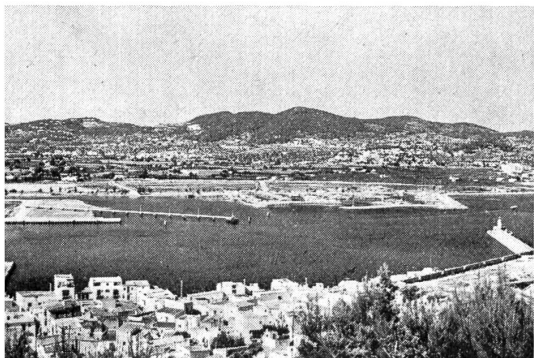
Teilansicht des Hafens von Ibiza

Am Montagabend schauten wir im Nachtlokal «Mar Blau» spanische Folklore an (Volkstänze usw.). Am Mittwoch fuhren wir kreuz und quer durch die Insel Ibiza. Ausserhalb der Stadt Ibiza besichtigten wir die Töpferei. Unterwegs nach San Antonio besuchten wir die Grotte Cova Santa. In San Antonio machten wir den ersten Halt und bummelten in der Stadt. Mittags um 12.30 Uhr ging's weiter zum Tierpark «Phantasieland». Dort werden verschiedene Tiere vorgeführt, und Seehunde, Dressurperle und Papageien zeigen, was sie gelernt haben. Wir fuhren durch eine malerische Landschaft. Die Gegend ist