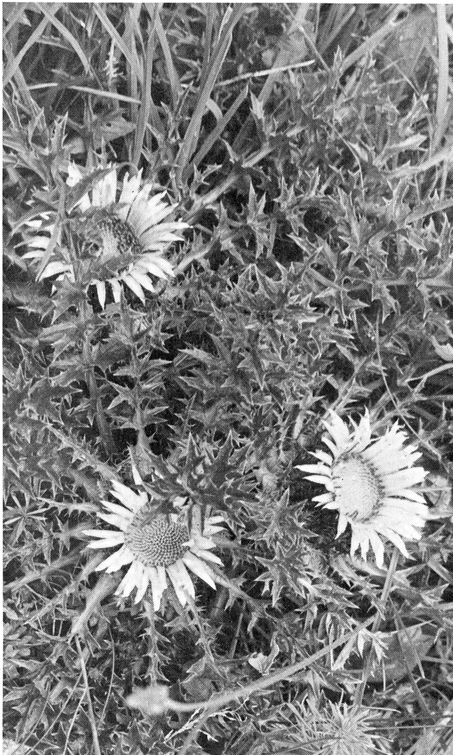
Silberdisteln-Sterne in den Bergmatten

Von Anfang an wurde der Bau mit speziellen Einrichtungen für taube Menschen ausgerüstet. Wenn z. B. ein Besucher in der Eintrittshalle auf den Knopf drückt, dann ertönt in der Wohnung kein Glockenzeichen, sondern es leuchtet ein