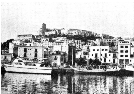
Wie eine Burg thront die Kathedrale von Ibiza auf dem Hügel im Hintergrund über der Stadt