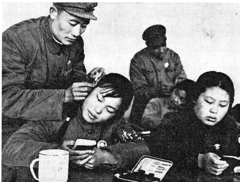
Unser Bild zeigt Akupunkturisten, welche taubstummen Kindern die Nadel ins Ohr stechen. Auch die Lehrer dieser Spezialschulen werden im Umgang mit der Nadel gründlich ausgebildet.