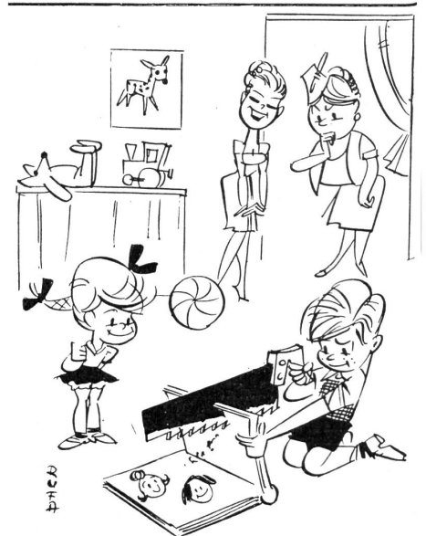
«Die lieben Kleinen — immer teilen sie alle ihre Geschenke.»

Jemand bezeichnete den Muttertag einmal als den «Tag des schlechten Gewissens». Er sei wie eine Eintagsfliege. Denn nur an diesem einzigen Tag werde die Mutter verwöhnt und beschenkt. Am Muttertag mache man plötzlich etwas, was man während des Jahres öfters tun sollte! Man sollte der Mutter im alltäglichen Leben durch Mithilfe im Haushalt an die Hand gehen. Man sollte die Mutter auch im alltäglichen Leben hie und da mit einem lieben und lobenden Wort erfreuen. Verteilt aufs ganze Jahr sind Liebe und Lob viel wirksamer als konzentriert auf einen einzigen Tag, eben den Muttertag. R.