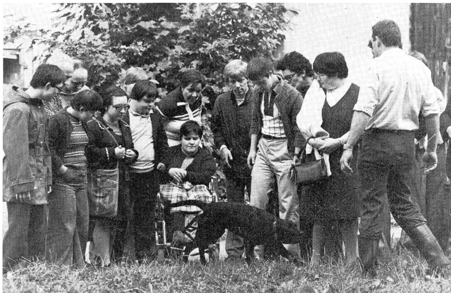
Zum Beispiel in der Freizeit, wie das Muster der Freizeitgruppe Winterthur/Andelfingen zeigt.