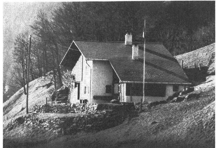
Neuer Anstrich am Haus mit umgebautem Dach vom Jahr 1976.