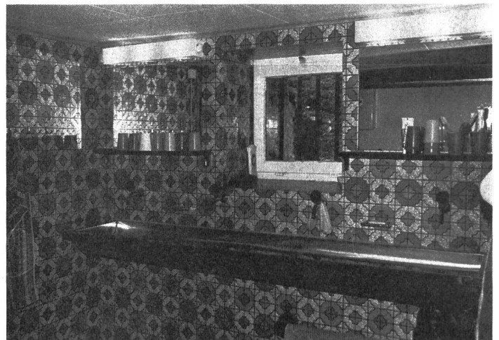
Neuer Waschraum ...