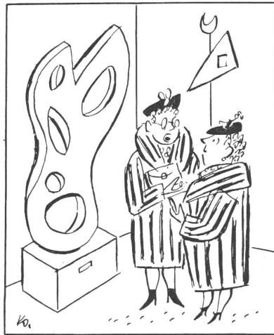
«Da fällt mir ein: Versichern Sie Ihren Pelz eigentlich gegen Motten?»

die Augen streuen lässt. Hier muss Halt geboten werden. Unsere Kunsthäuser gehören der Öffentlichkeit, dem Volk. Wer als Privatmann Sammler solcher Dinge ist, soll es sein. Er soll seine Freude an seiner Sammlung haben!