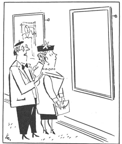
«Hier steht: Schöpferische Pause.»

Wir haben zur Frage Kunst nichts mehr beizufügen. Jeder Leser soll sich nun seine Gedanken selbst machen. EC.