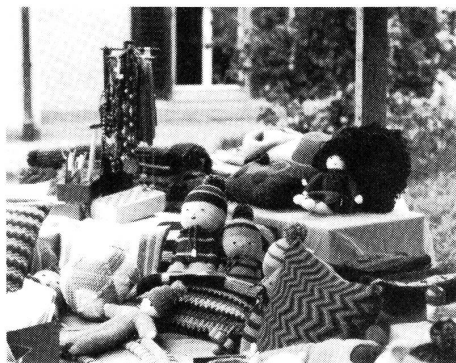
Ein Teil des Bazars.

gramm, um nur einige zu nennen: Sackgumpen, Ballonspiele. Wer isst den Apfel an der Schnur am schnellsten? Einen Löffel in die Hand nehmen und mit einem Ei drin umherlaufen usw.