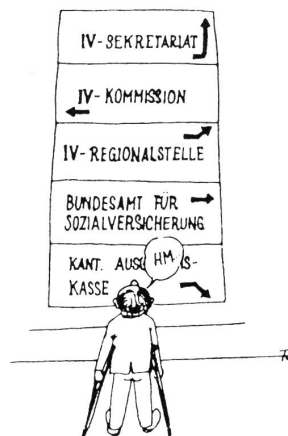
F. Lohri, in: «Behindert – was tun?»

Das IV-Sekretariat, die IV-Kommission und die IV-Regionalstelle sollen zu einem einzigen Organ zusammengefasst werden: der IV-Vollzugsstelle. Damit würde das bisherige «Milizsystem» (die Mitglieder der IV-Kommissionen sind nebenamtlich tätig) durch eine Fachstelle mit vollamtlichen Mitarbeitern abgelöst.