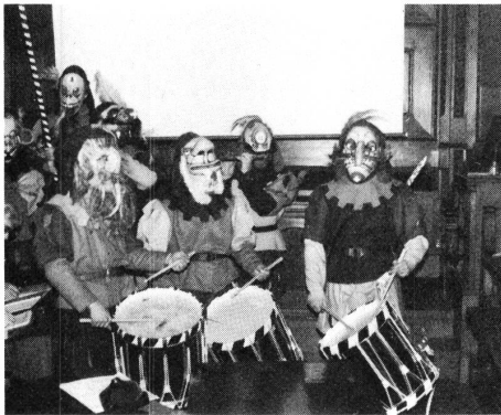
Die Fasnachtsclique «Optimische» im Einsatz.