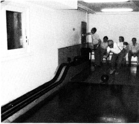
Wer hier wohl gewinnt?

deoaufzeichnungen von den letzten zwei Fernsehsendungen «Sehen statt Hören». Es wurde eifrig diskutiert über die 10 Gebärdenthesen des SGB.