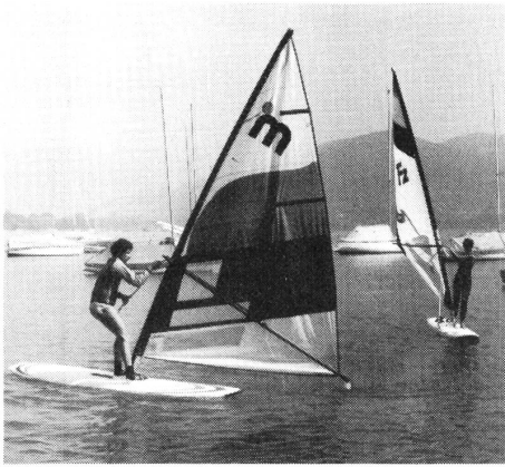
Übung macht den Meister